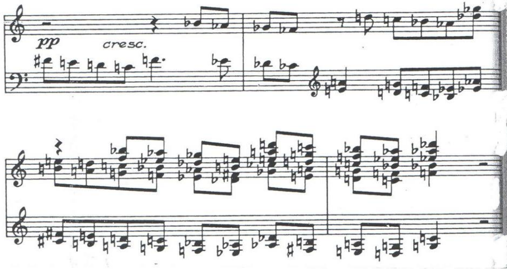
شكل رقم (٣)

BERG: Wozzeck—Act I Scene 4 (1914–21) p70