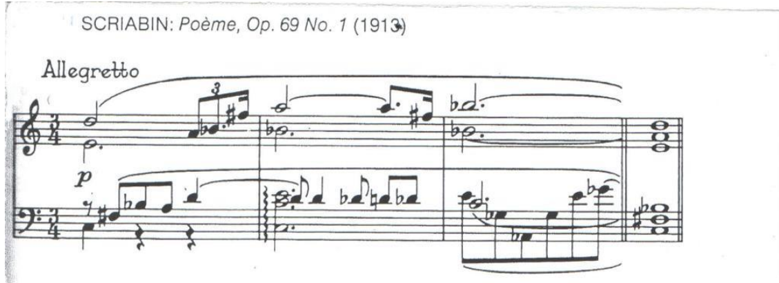
شكل رقم (٤)

وفي المثال التالي استخدم سكريابين التآلف الغامض MYSTIC CHORD (والذى ينسب إليه